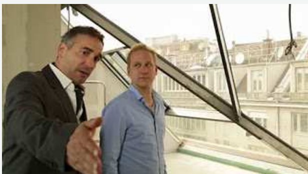
Klimawandel im Jahr 2050 – Gut angepasst? https://www.youtube.com/watch?v=cvJ2D_kev08