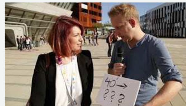
Klimawandel 2050 in Österreich – Was steht uns bevor? https://www.youtube.com/watch?v=UZRSm-vz_as

Kooperation Umweltbundesamt, Klimafonds, BMLFUW