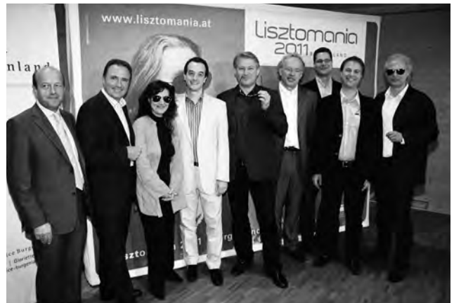
8. Burgspiele Güssing „Ein idealer Gatte“ 9. Schlossspiele Kobersdorf „Ein Sommernachtstraum“ 10. 5. Burgenländische Tanztage im OHO Oberwart 11. Neues Kinderprogramm mit „Willi, der Wulkafrosch“ 12. Präsentation der Konzerthighlights der Lisztomania 2011