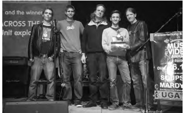
1. Seefestspiele Mörbisch „Der Zarewitsch“ 2. Kulturparndorf Sommertheater „Die Zähmung der Widerspenstigen“ 3. Festivalsommer Jennersdorf „Die verkaufte Braut“ 4. Pannonisches Forum Kittsee „Klassische Kapelle Wien“ 5. Ausstellung im Schloss Halbturn 6. limmitationes „The Michael Mussillami Trio“ 7. Sieger des Bgld. Music Video Awards 2010, Preisverleihung in der KUGA Großwarasdorf