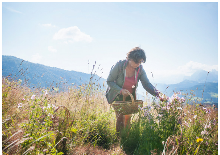
Auf den wilden Wiesen pflückt die frischgebackene Bäuerin Kräuter, stellt daraus Produkte her und erforscht ihre Wirksamkeit.

– Vereinigung der Seniorenstudentinnen und -studenten: www.seniorenstudium.at