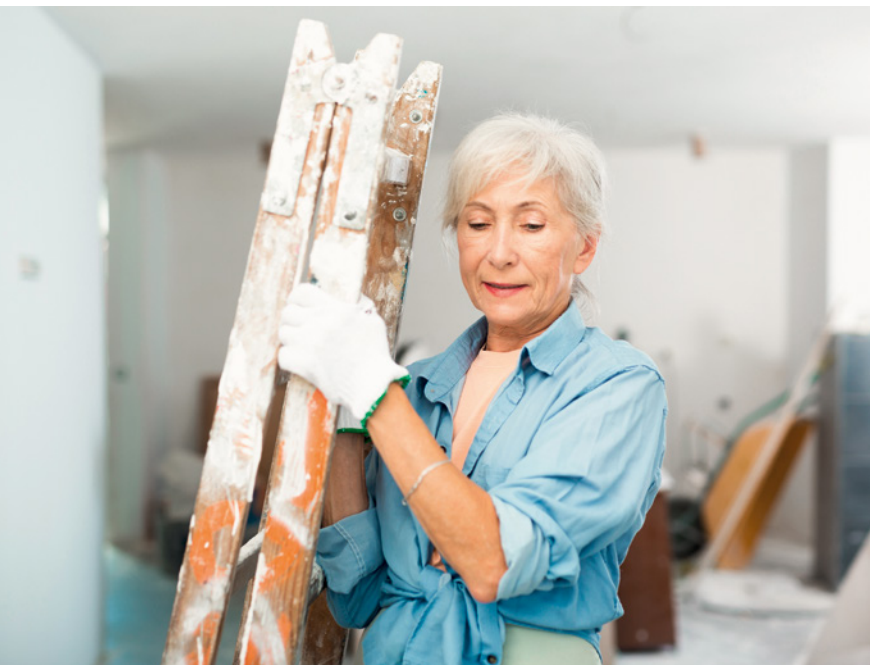
Fernab vom Klischee der Pensionistin: voller Elan in einen neuen Lebensabschnitt