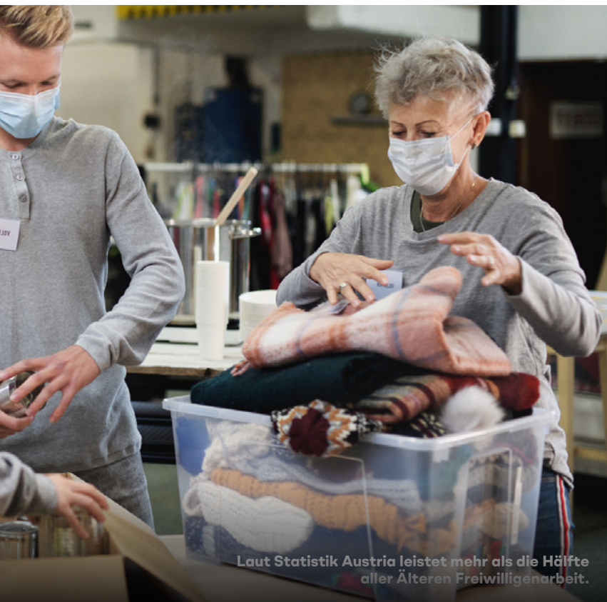
Laut Statistik Austria leistet mehr als die Hälfte aller Älteren Freiwilligenarbeit.

Sie leisten Care-Arbeit, versorgen Partner*innen, Kinder, Enkelkinder und übernehmen darüber hinaus noch Ehrenämter. Frauen ab 60 werden nicht umsonst als „Rückgrat der Gesellschaft“ bezeichnet.