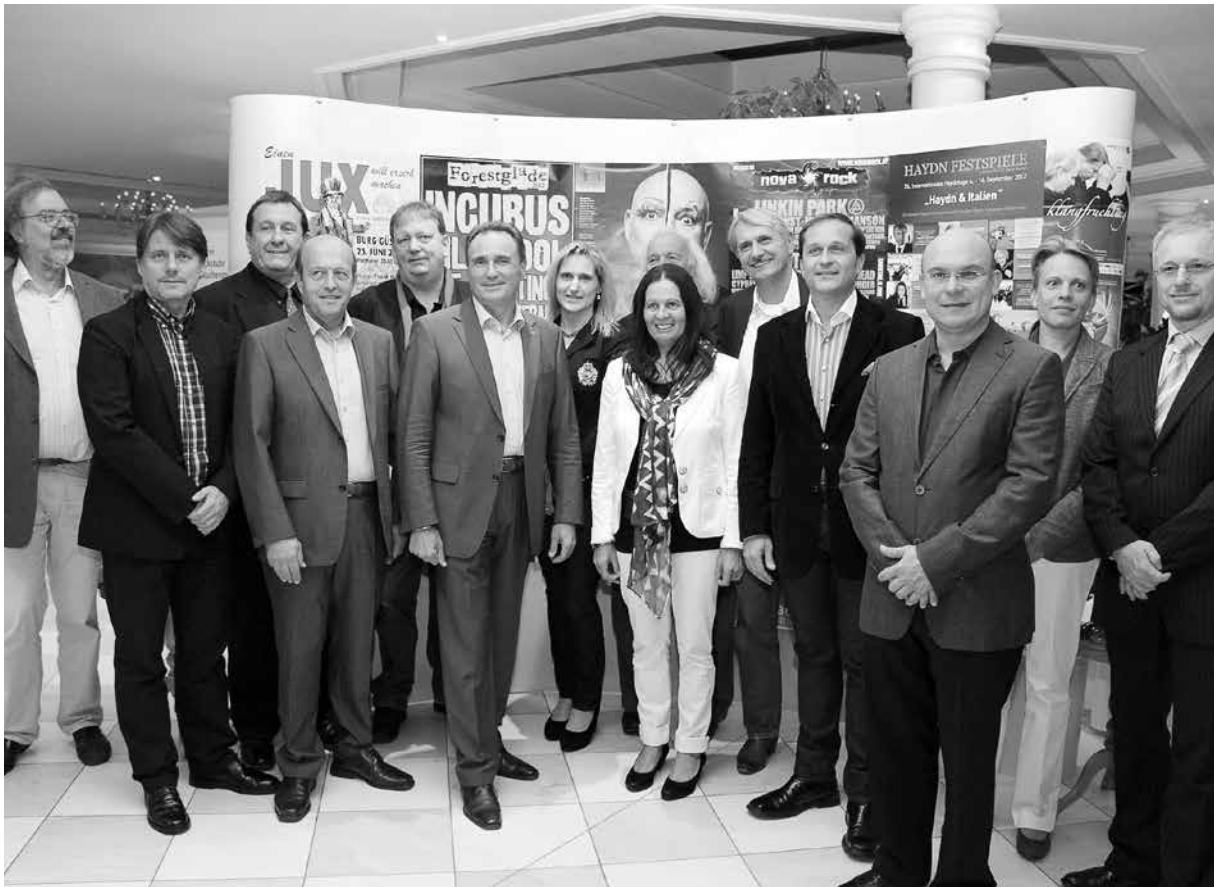
1 Kunst am Bau - Wettbewerb 2 Schlosskonzerte Halbturn 3 J:opera Jennersdorf „Der Wildschütz“ 4 Abschluss Kultursommer