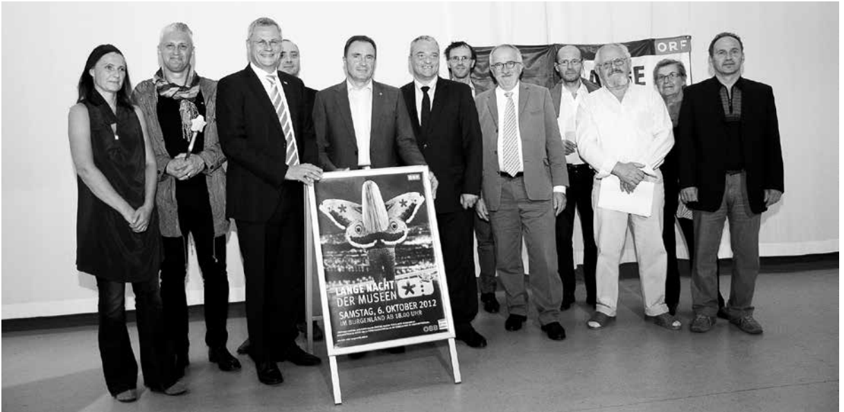
5 Güssinger Kultursommer „Einen Jux will er sich machen“ 6 Österreich liest 7 Int. Jenő Takács Klavierwettbewerb 8 Lange Nacht der Museen