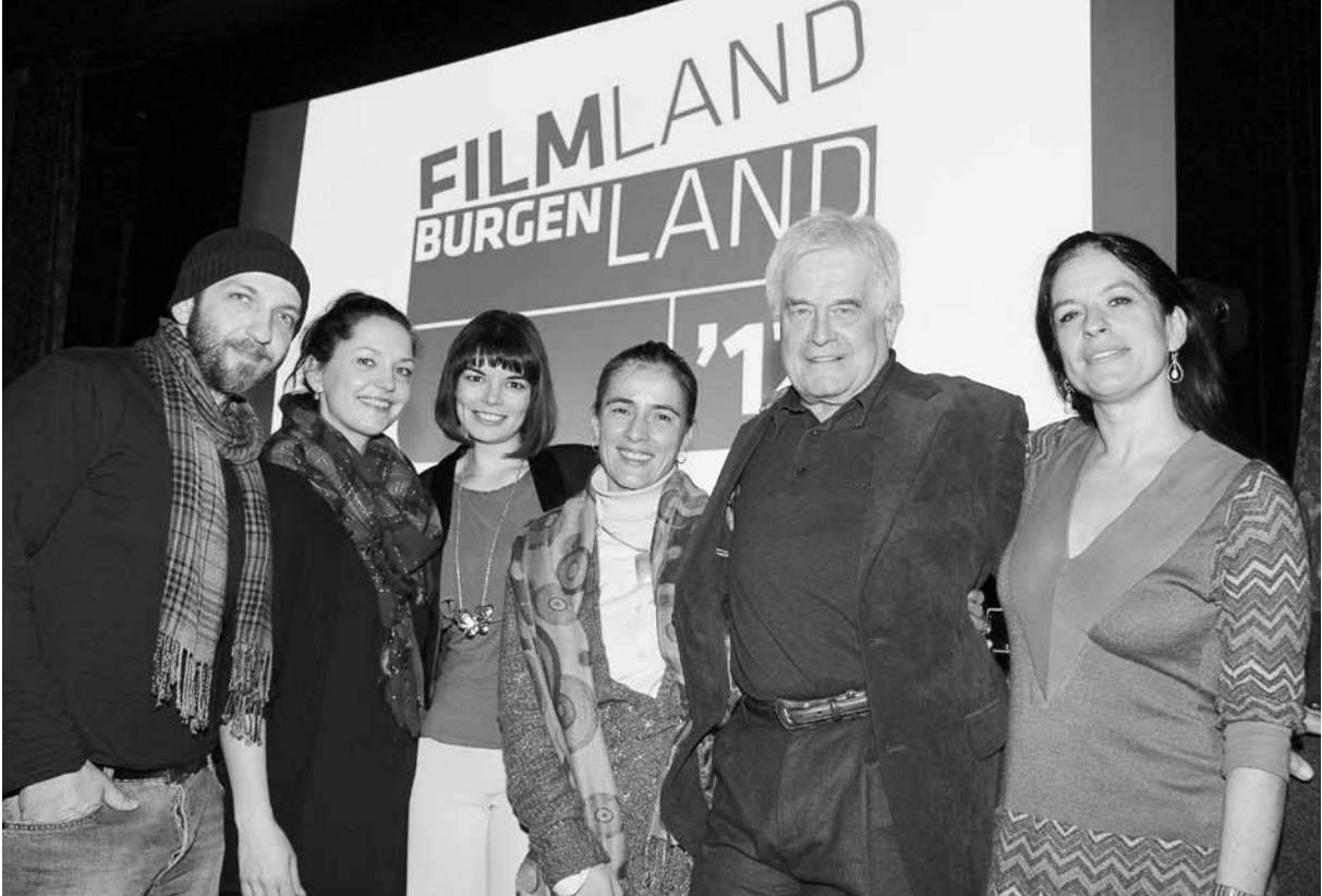
9 Präsentation - Konzertprogramm der Kulturzentren 10 Musical Güssing 11 Literaturpreisverleihung 12 Kinderfilmfestival Oberpullendorf 13 FilmLand Burgenland