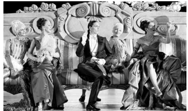
14 Ausstellung „Eine Haydn-Arbeit“ 15 Filmreihe „Drehort Burgenland“