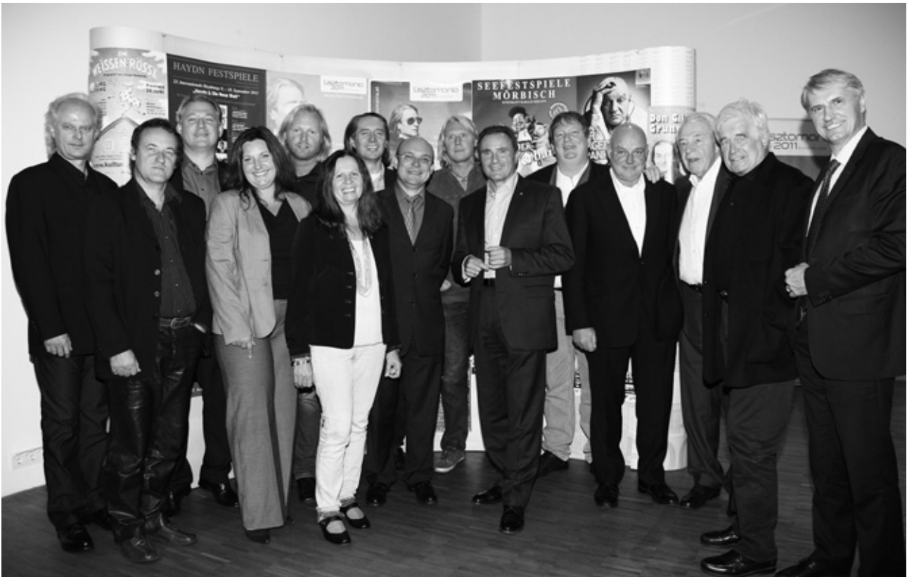
1 Tastentiger Raiding 2 Eröffnung der Intern. Haydntage 3 Präsentation Liszt-Hörspiel 4 Bgld. Amateurtheaterpreis „Rot-Goldenes-Brett!“ 5 Kultursommer Raiding