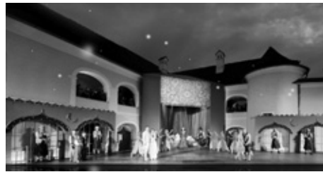
6 Präsentation des „Historischen Atlas Burgenland“ 7 Güssinger Kultursommer „Zum Weißen Röbl“ 8 limmitationes „classic meets blues ambiente“ 9 Seefestspiele Mörbisch 10 Kulturservice 2011 11 Österr. Archivtag in Eisenstadt 12 :opera Festivalsommer Jennersdorf „Entführung aus dem Serail“