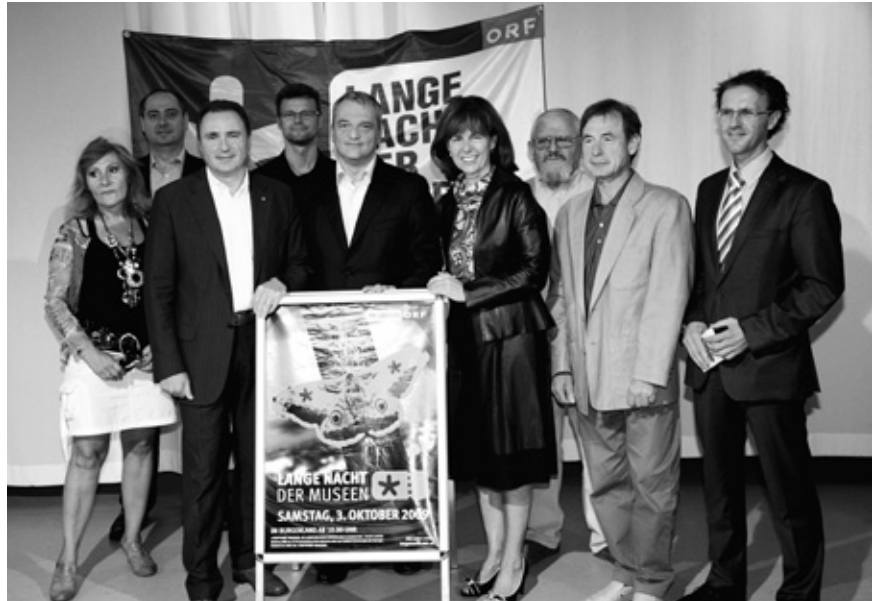
6 Ausstellung „Schornsteinkünstler“ im Muba Neutal 7 „Klangfrühling“ auf Burg Schläining 8 Musical Güssing „Carousel“ 9 „Brandner Kaspar und das ewig Leben“ im Rahmen des „Güssinger Kultursommers“ 10 Preisträger des „Burgenländischen Buchpreises 3x7“ 11 Halbtürner Schlosskonzerte 12 „Lange Nacht der Museen“