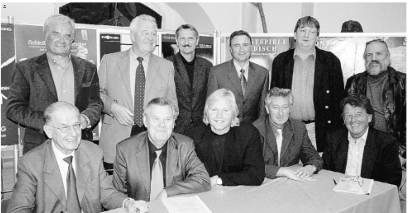
1 „Woche der Erwachsenenbildung“, Informationsveranstaltung in der Fußgeherzone Eisenstadt. 2 Ensemble „Forchtenstein Fantastisch“, Foto BF. 3 Präsentation Bühnenbild „Zigeunerbaron“, Foto BF. 4 Kulturmanager zogen mit Landesrat Helmut Bieler Bilanz: gemeinsam konnte ein Rekord von 450.000 Besuchern im burgenländischen Kultursommer 2000 erzielt werden. Foto BF.