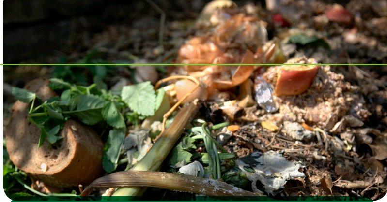
Erntereste und Biomüll aus der Küche gehören auf den Kompost

Bei der Kompostierung folgen wir den natürlichen Kreisläufen. Was wir dem Garten entnehmen, geben wir über die Kompostierung wieder zurück. Kompost dient als wertvoller, lebendiger Nährstoffspeicher und damit als wichtigster organischer Dünger im Naturgarten.