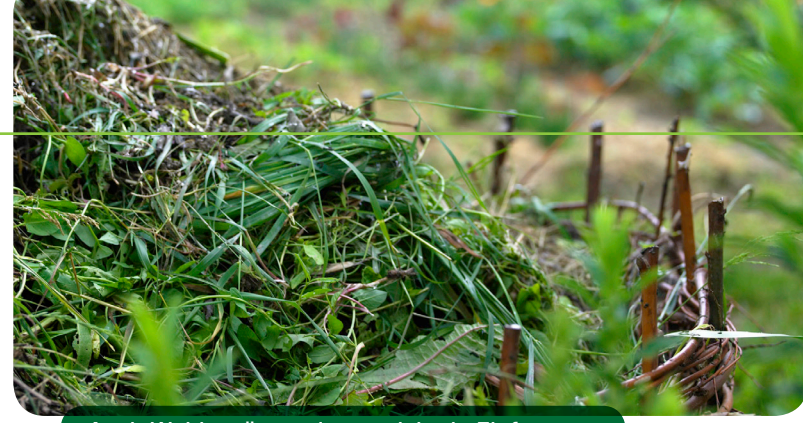
Auch Weidenzäune eignen sich als Einfassung