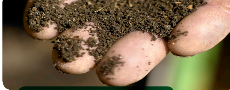
Reifer Kompost duftet erdig