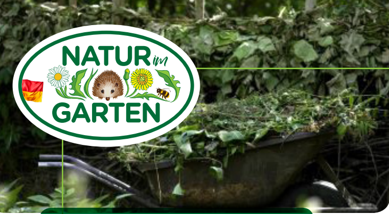
Grünschnitt ist eine wichtige Kompost-Zutat