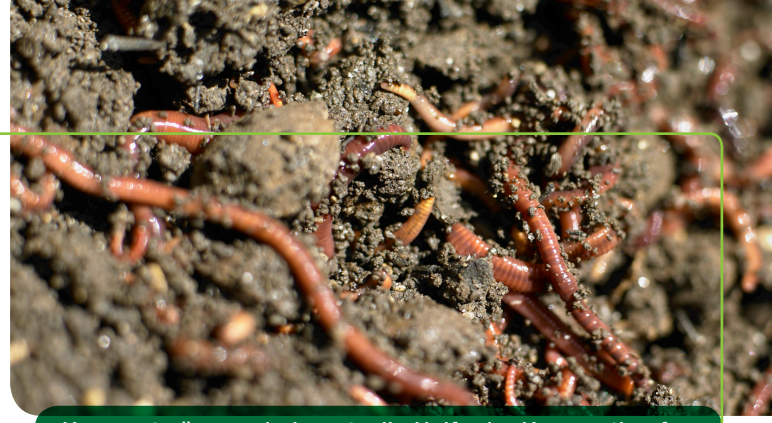
Kompostwürmer sind wertvolle Helfer im Komposthaufen