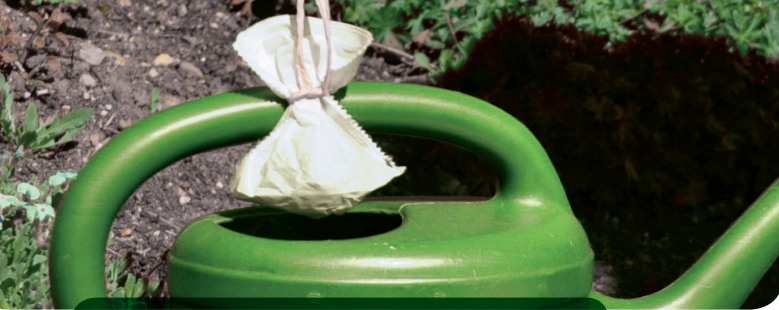
Komposttee ist ein toller Flüssigdünger